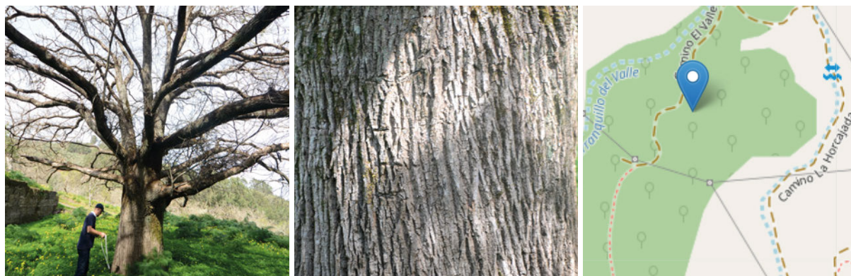
FICHA TÉCNICA | CASTAÑO DE LA MAJADA DE FONTANALES

En terrenos privados de la Heredad de Aguas de Moya, cerca del pueblo cumbreiro de Fontanales, se encuentra, entre una variada vegetación arbórea, una plantación de castaños. Entre ellos destaca un hermoso ejemplar de 1,37 metros de diámetro de tronco que se abre en varios ramales muy bien formados, sosteniendo sus más de 25 metros de copa aparasolada. Resulta raro encontrar ejemplares de castaño que, por aprovechamientos, no hayan visto alguna vez amputadas sus ramas, siendo éste el caso, pues su conservada bóveda, a modo de techumbre, ha venido sirviendo de cobijo como majada para el ganado ovino y descanso de pastores.