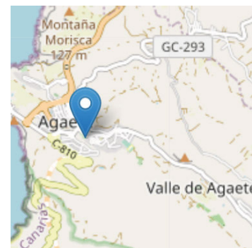
FICHA TÉCNICA | HIGUERA BLANCA DEL HUERTO DE LAS FLORES